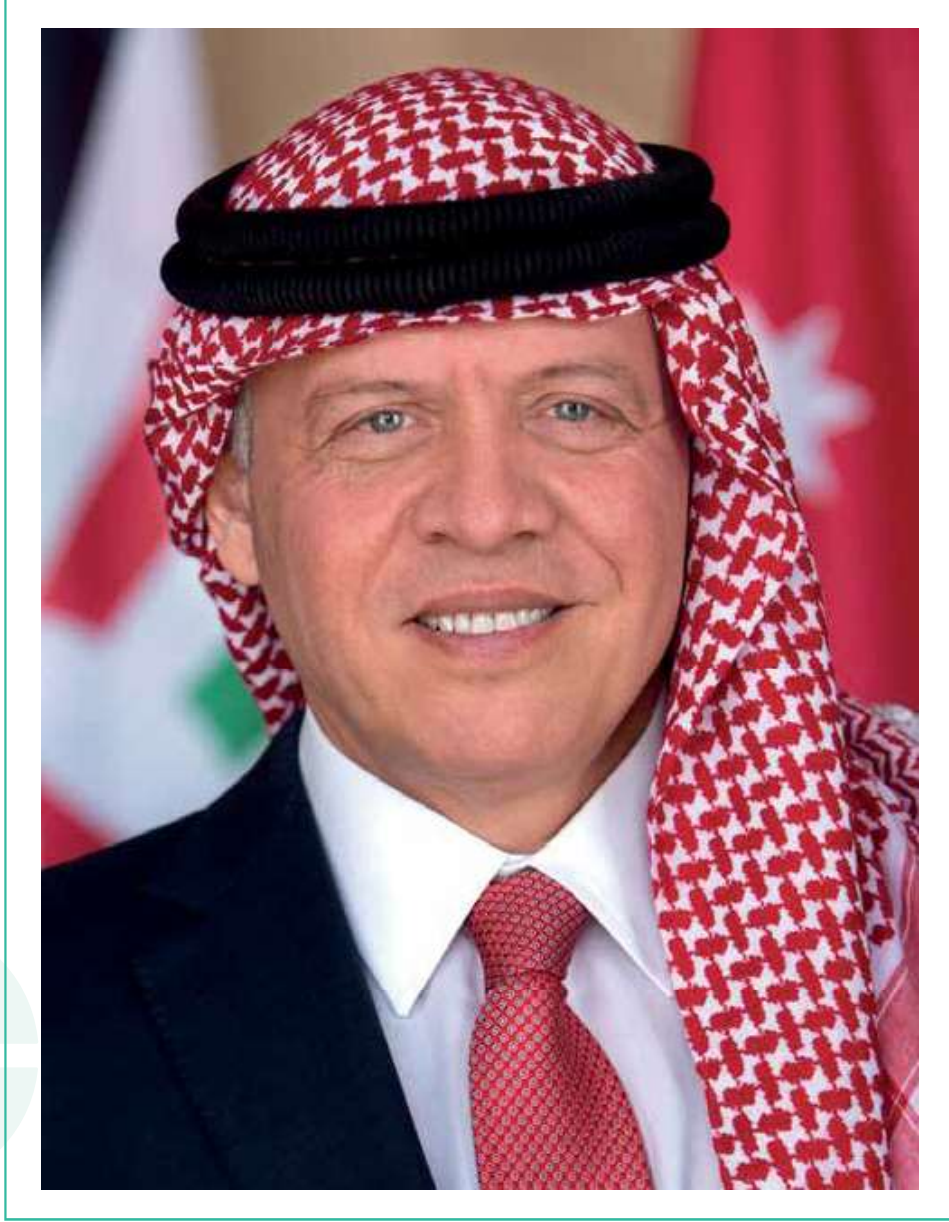
حضرة صاحب الجلالة الهاشمية الملك عبد الله الثاني ابن الحسين المعظم حفظه الله